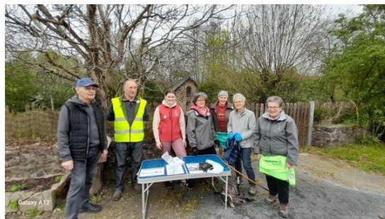
Photo avec la fédération de randonnée pédestre Inter Amnes