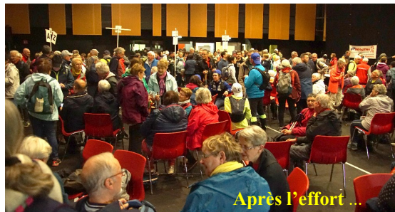
Après l'effort ...

Un diaporama de cette journée est disponible sur le site internet.